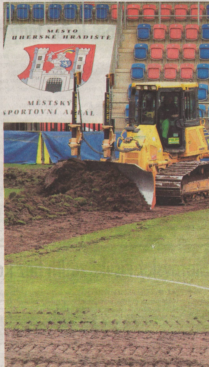
DOŠKA A SPOL. VYŠTRÍDALY BULDOZERY ■ Městský fotbalový stadion Miroslava Valenty v Uherském Hradišti obsadila těžká technika. Do prvoligového trávníku se v neděli zakously buldozery a bagry. V rámci rekonstrukce stadionu na červnový šampionát hráčů do 21 let se kompletně vymění celá hrací plocha, která patří k nejstarším v celé SYNOT lize. Stále se totiž jedná o tu původní z roku 2003, kdy se celý stadion otevíral. Kompletní výměna hrací plochy včetně vytápění a odvodnění bude hotova za měsíc, kdy na Slovácko přijede Liberec.